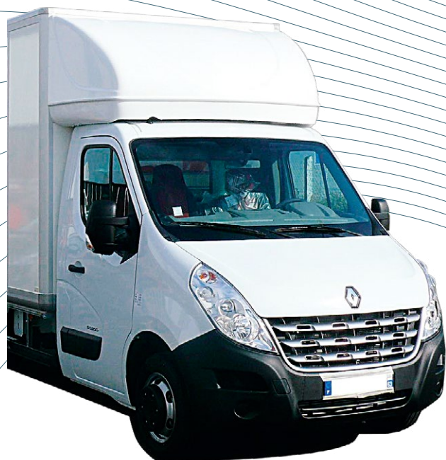
Capucine profilée chassis cabine