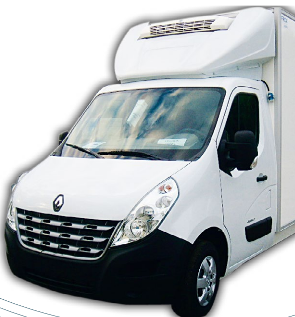
Défecteur 3D positionnable