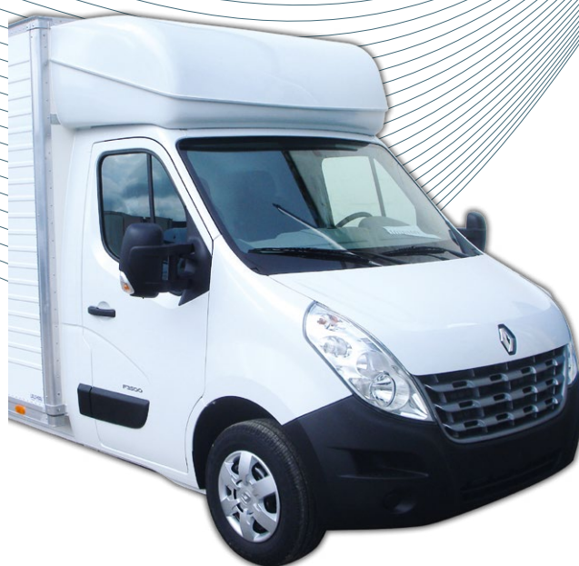
Capucine profilée plancher cabine