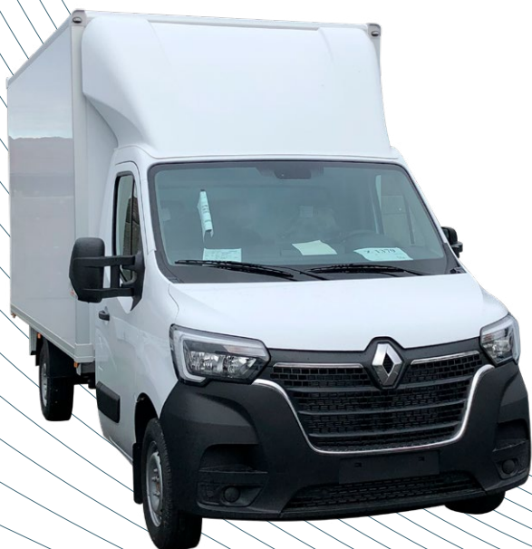
Défecteur 3D fixe