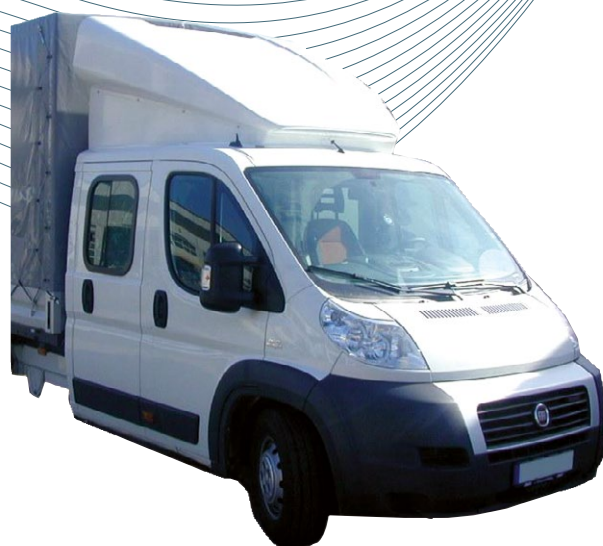
Défecteur positionnable double cabine