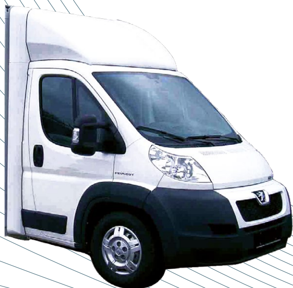
Défecteur fixe + anti-vortex