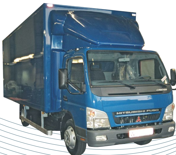
Déflecteur positionnable + anti-vortex