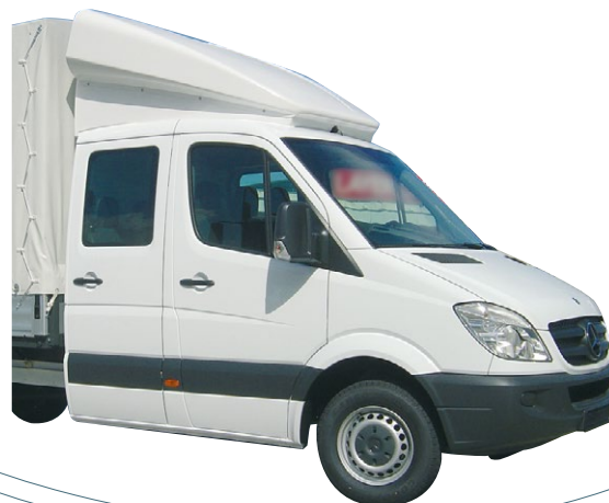
Défecteur positionnable double cabine