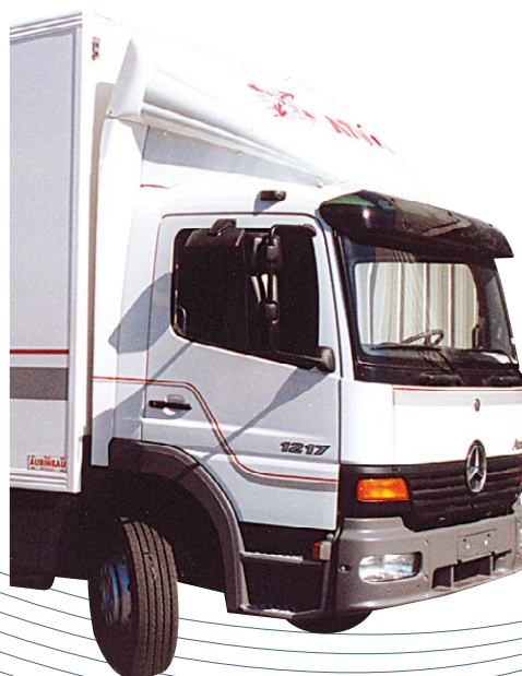
Défecteur positionnable + anti-vortex