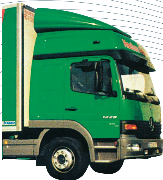
Défecteur positionnable cabine longue réhaussé