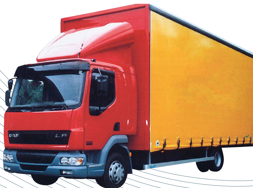
Défecteur positionnable cabine longue