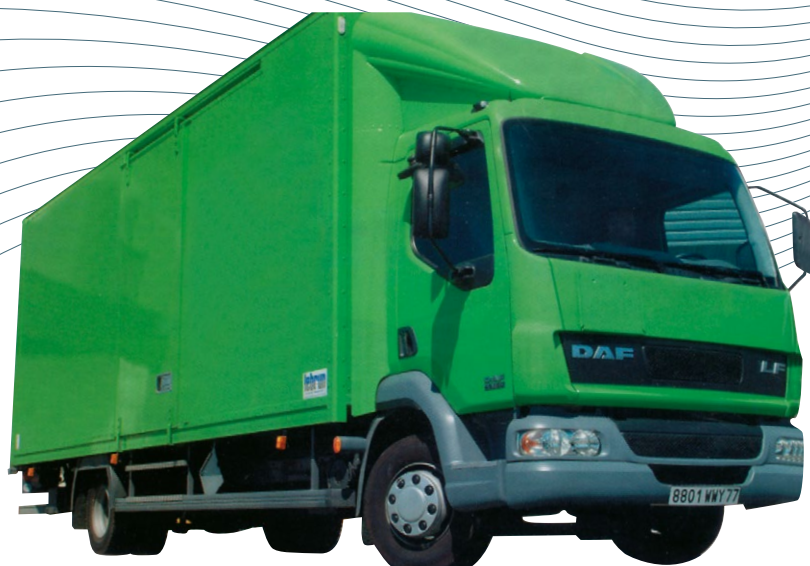
Défecteur positionnable + anti-vortex cabine courte