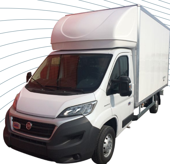
Capucine chassis cabine