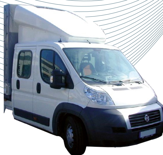
Déflecteur positionnable double cabine